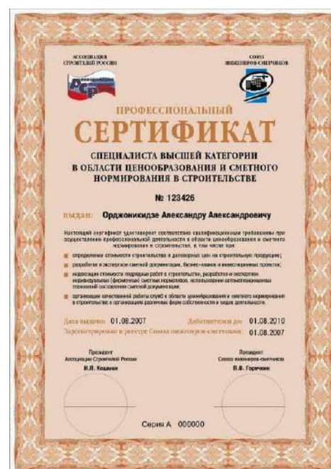
СЕРТИФИКАТ СПЕЦИАЛИСТ СМЕТЧИК ВЫСШЕЙ КАТЕГОРИИ