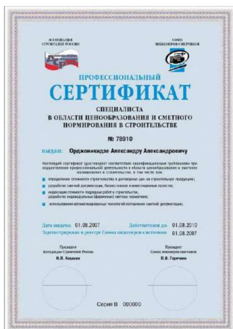
СЕРТИФИКАТ СПЕЦИАЛИСТ СМЕТЧИК

Вы получите документы следующего вида и содержания.