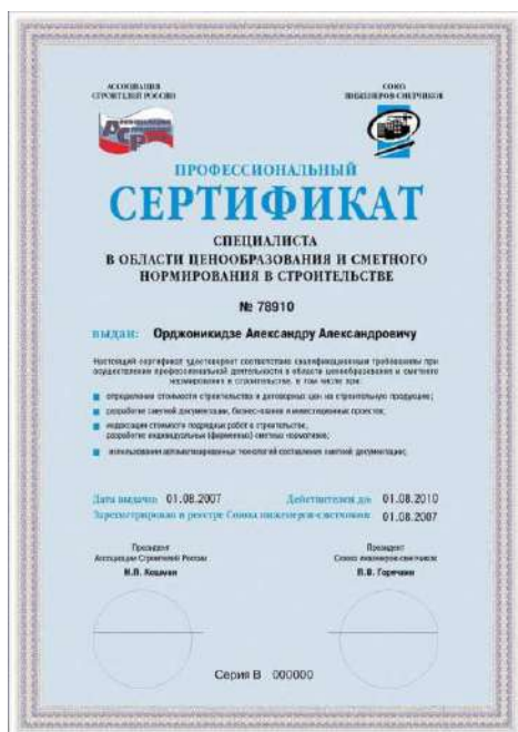
СЕРТИФИКАТ СПЕЦИАЛИСТ СМЕТЧИК